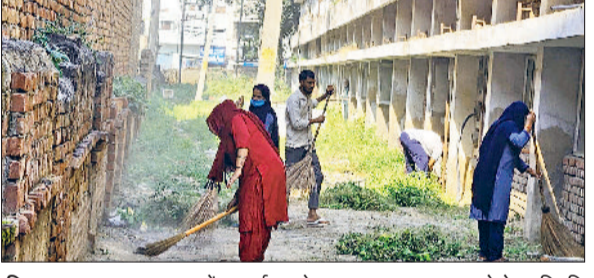
भिवान। सामान्य अस्पताल में सफाई करते हुए।