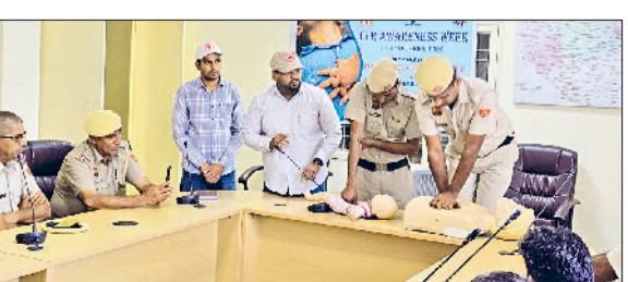
भिवानी। बेसिक फर्स्ट एड सीपीआर का प्रशिक्षण लेते पुलिसकर्मियों।