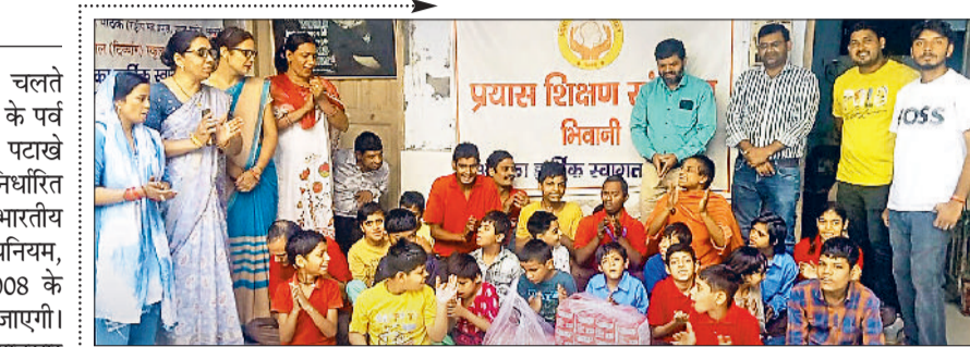
भिवानी। प्रयास स्पेशल स्कूल के बच्चों को दीपावली पर उपहार देते पालेराम चैरिटेबल ट्रस्ट के सदस्य।